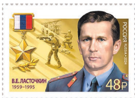
Почтовая марка в память о Герое России В.Е. Ласточкине

Александр ТАРАСОВ